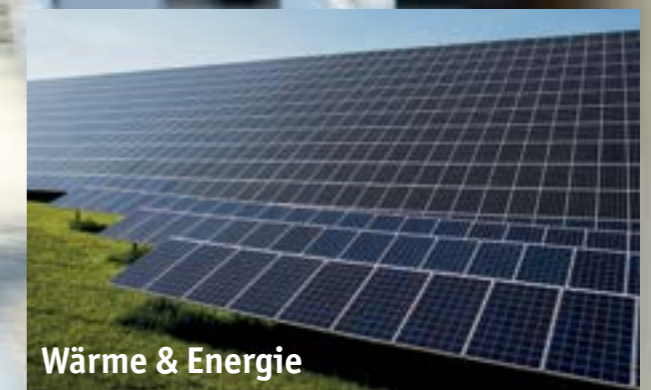
Wärme & Energie

Glas-Keramik-Metallverbindungen für die Röntgentechnik